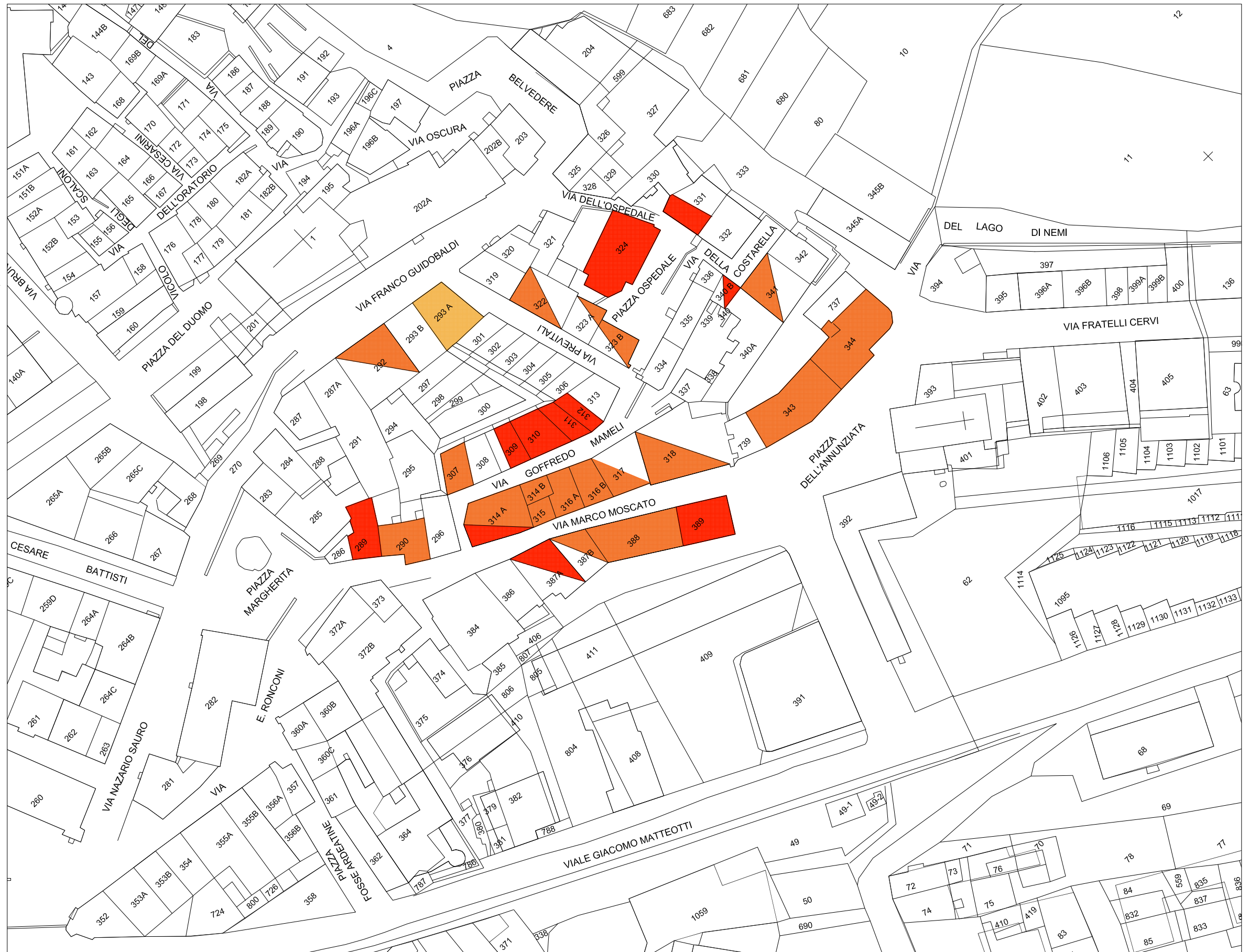
STRALCIO PLANIMETRIA catastale Rapp. 1/1000