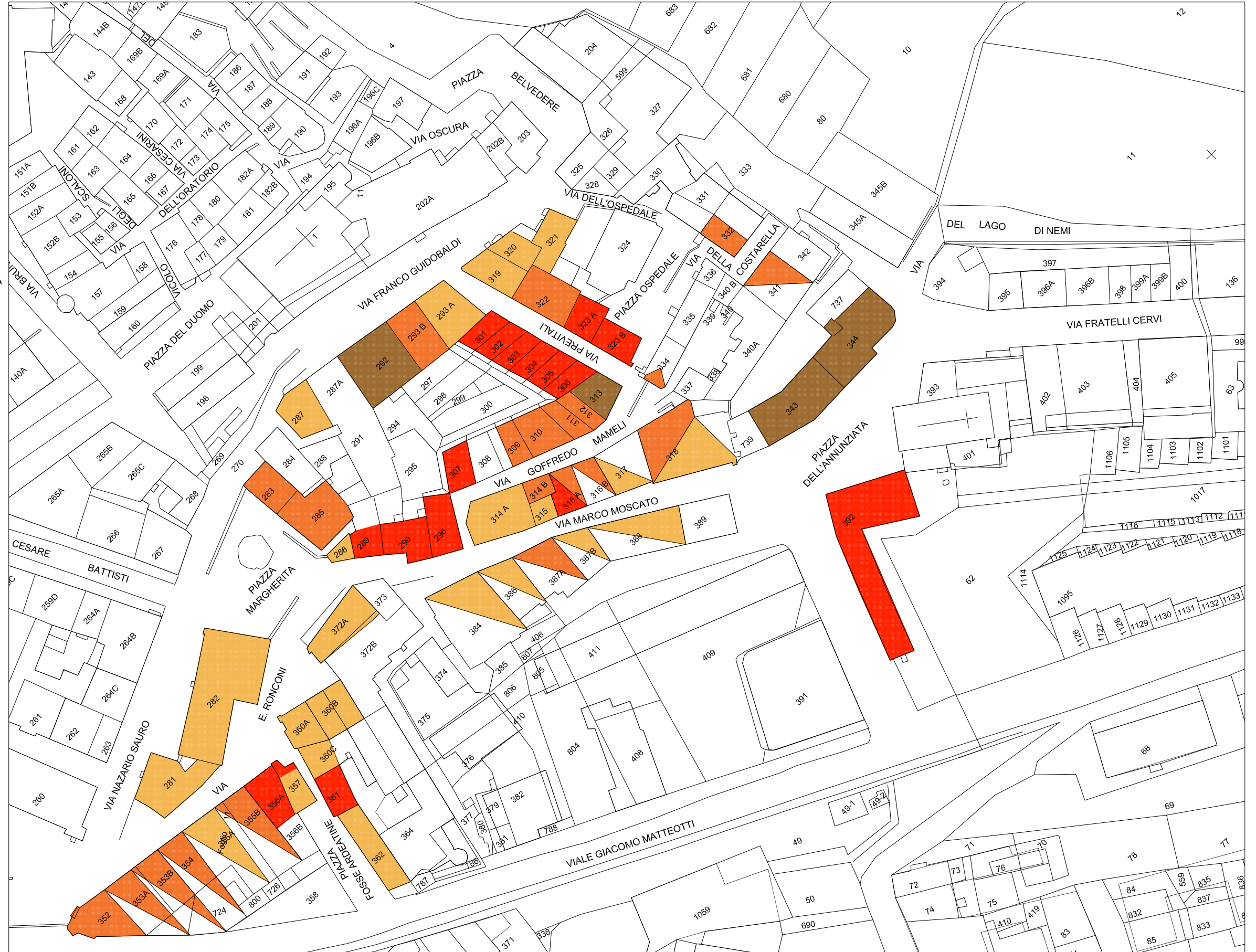
STRALCIO PLANIMETRIA catastale Rapp. 1/1000