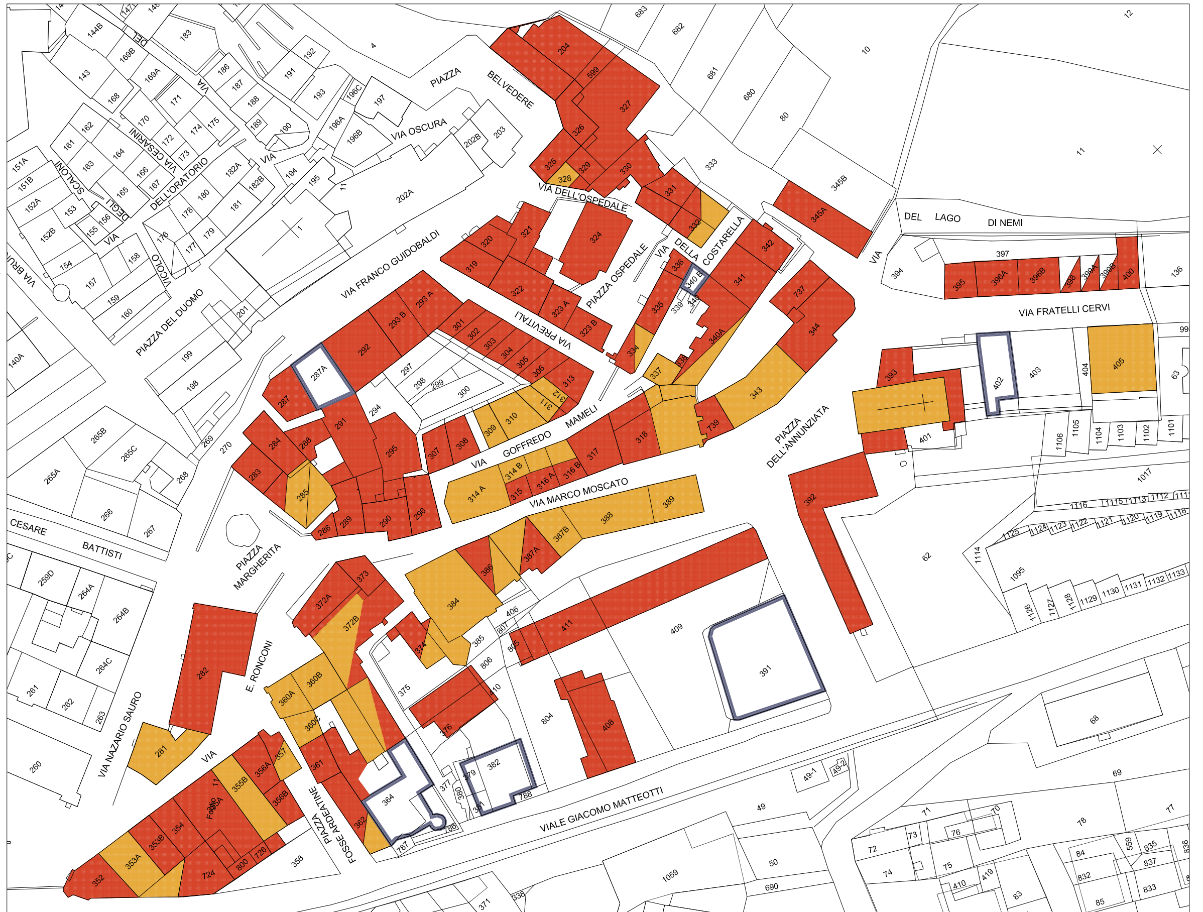
STRALCIO PLANIMETRIA catastale Rapp. 1/1000

PREVALENZA DI ALTRI RIVESTIMENTI (CORTINA LATERIZIA, TESSERE CERAMICHE ECC)