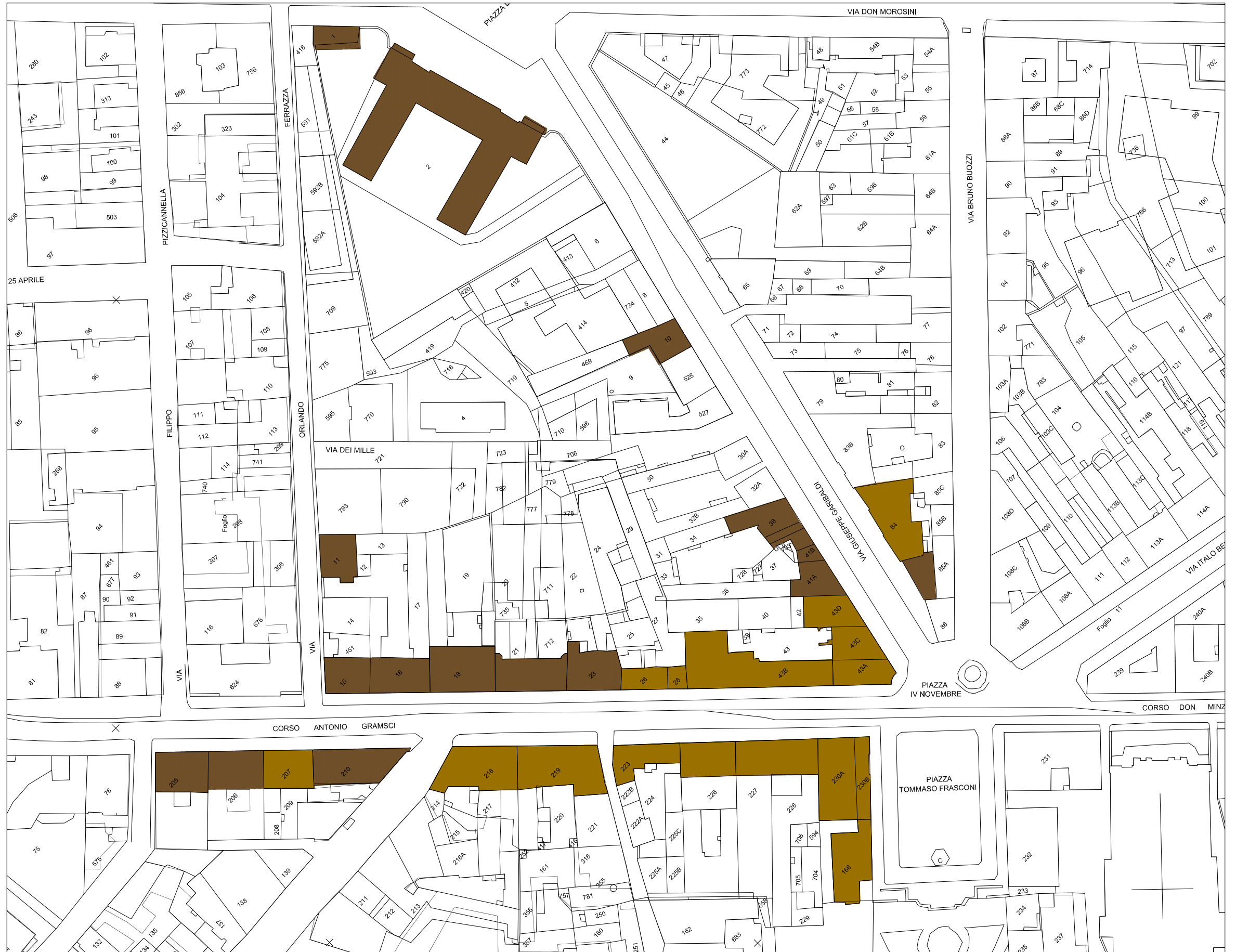
STRALCIO PLANIMETRIA catastale Rapp. 1/1300

PARZIALMENTE CONSERVATO IN SITO CON ELEMENTI RELITTI