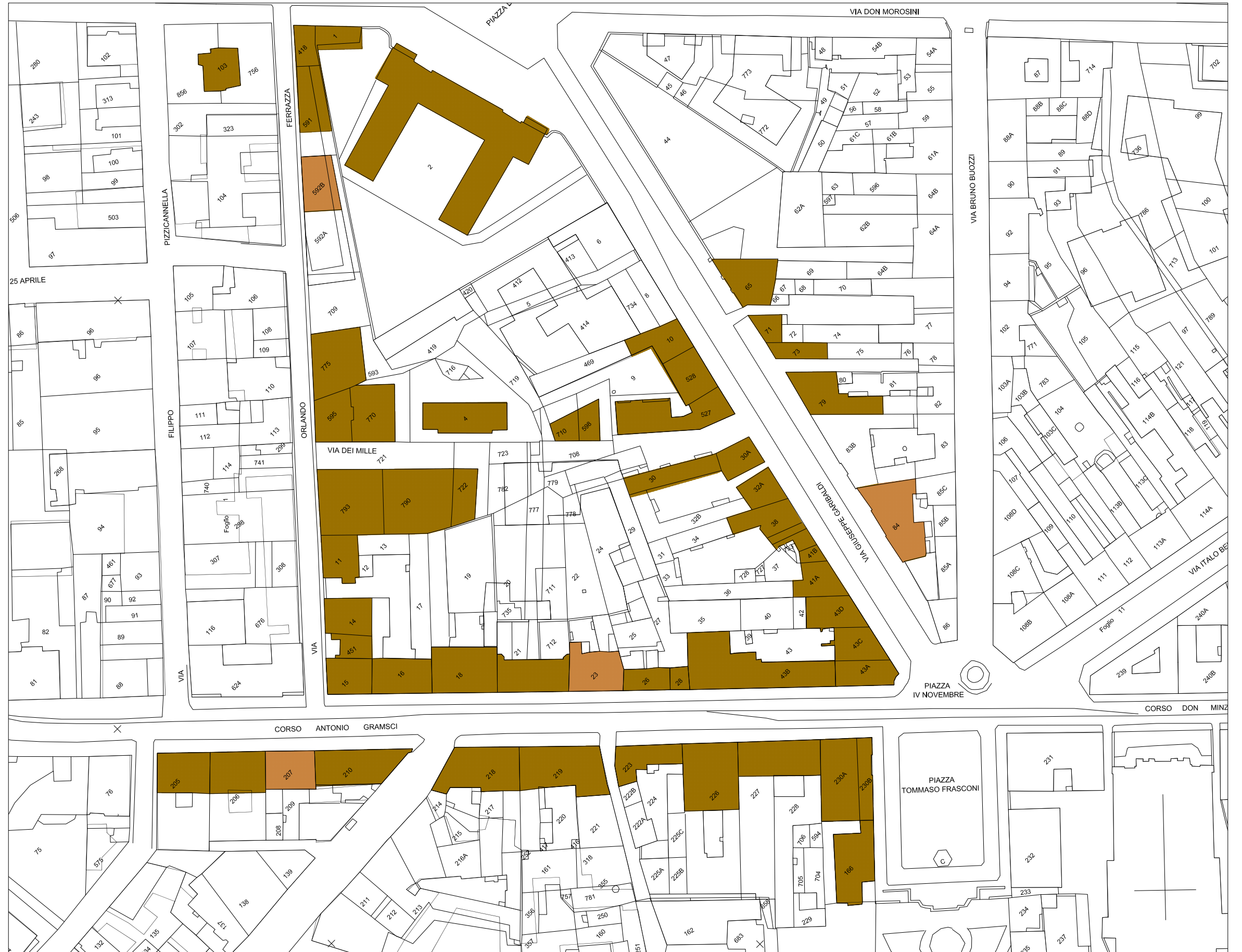
STRALCIO PLANIMETRIA catastale Rapp. 1/1300