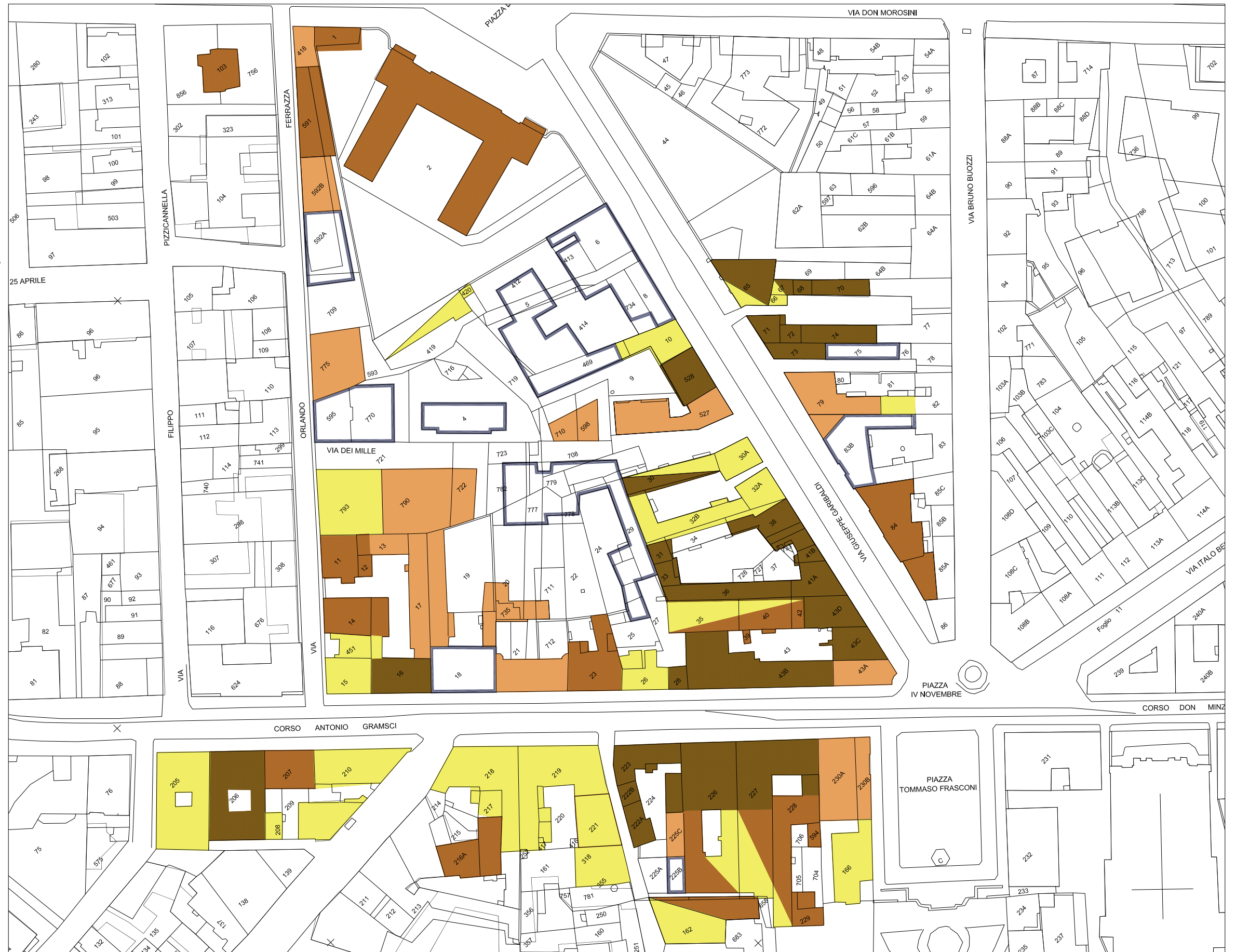
STRALCIO PLANIMETRIA catastale Rapp. 1/1300