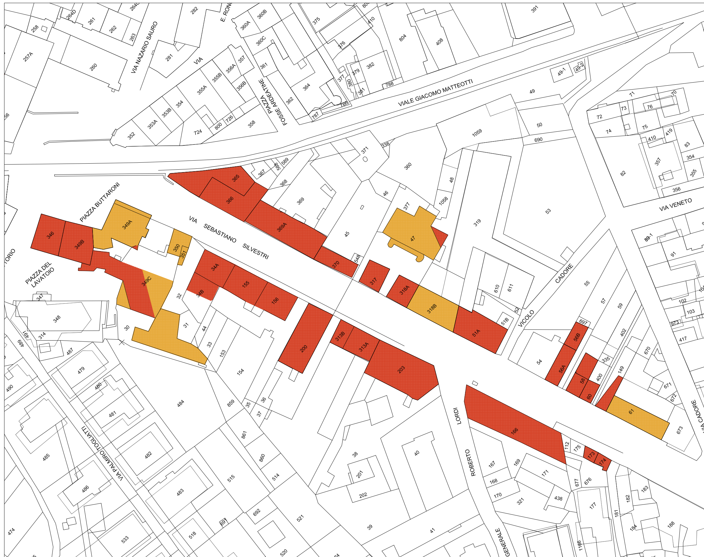
STRALCIO PLANIMETRIA catastale Rapp. 1/1000