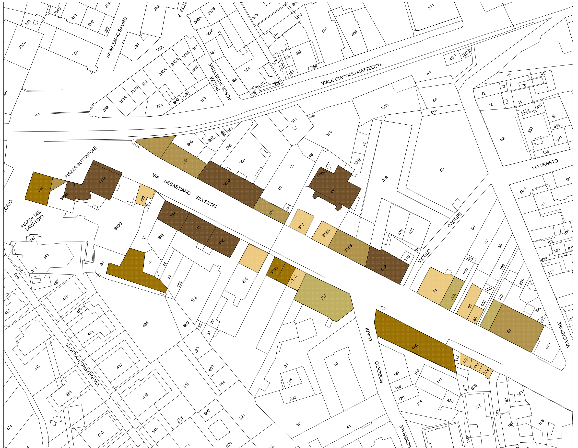
STRALCIO PLANIMETRIA catastale Rapp. 1/1000