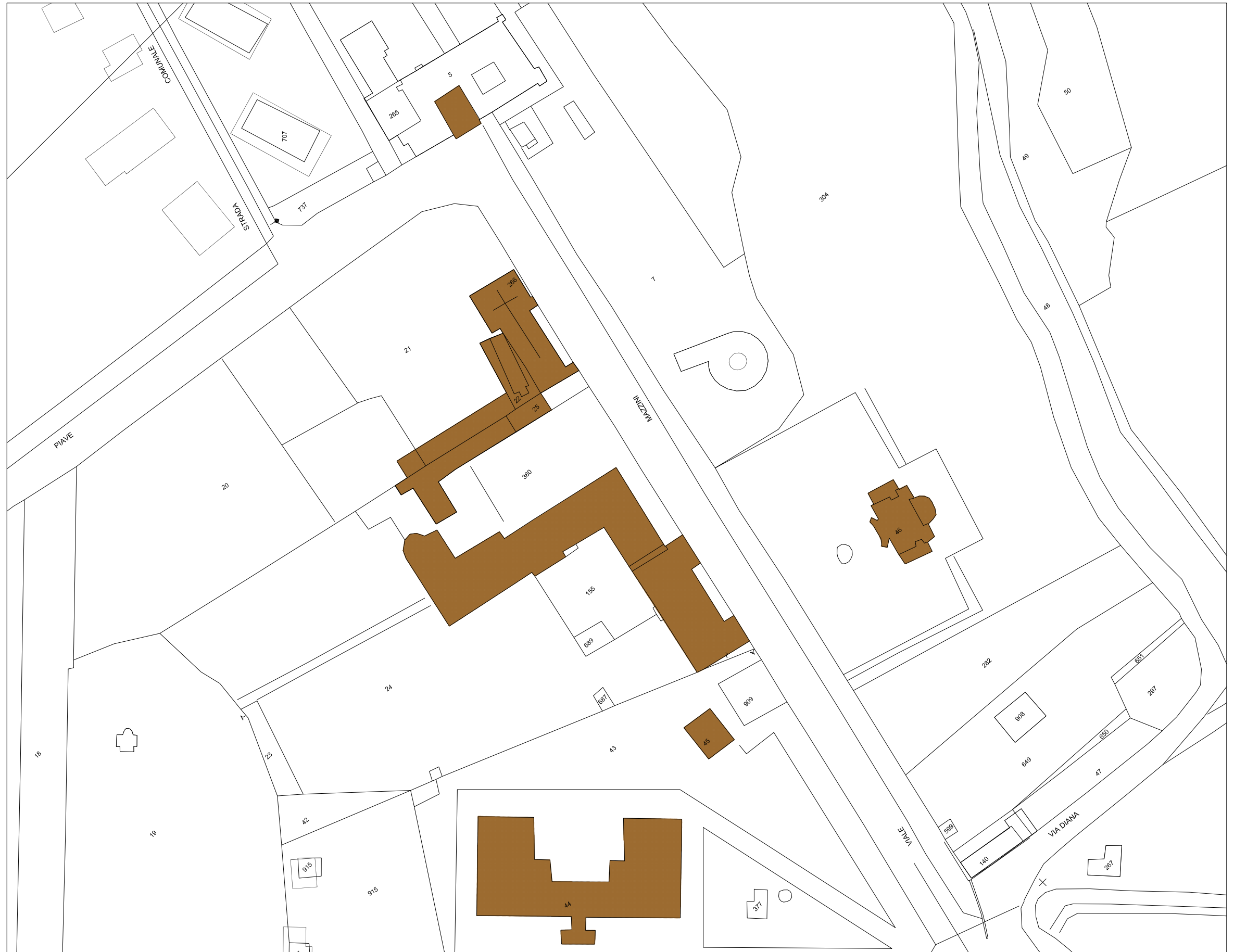
STRALCIO PLANIMETRIA catastale Rapp. 1/1300