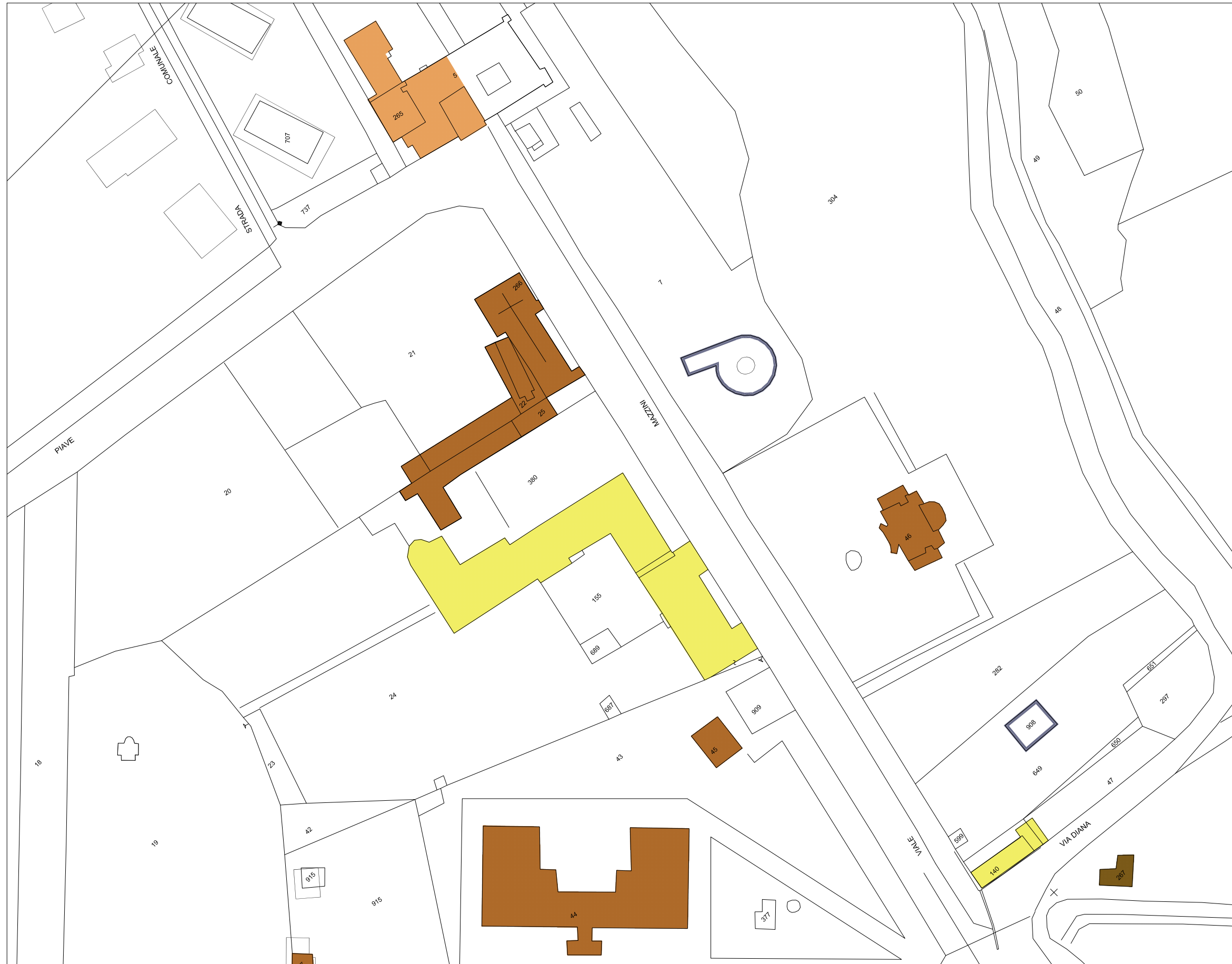
STRALCIO PLANIMETRIA catastale Rapp. 1/1300