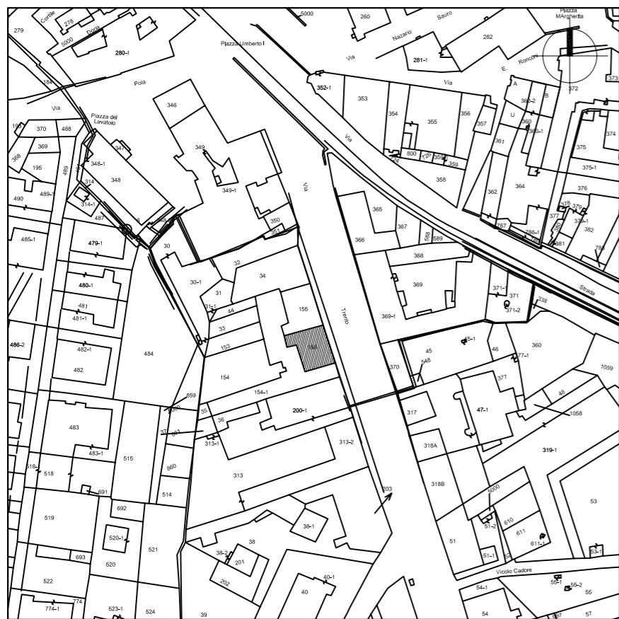
STRALCIO PLANIMETRIA CATASTALE Rapp. 2'000