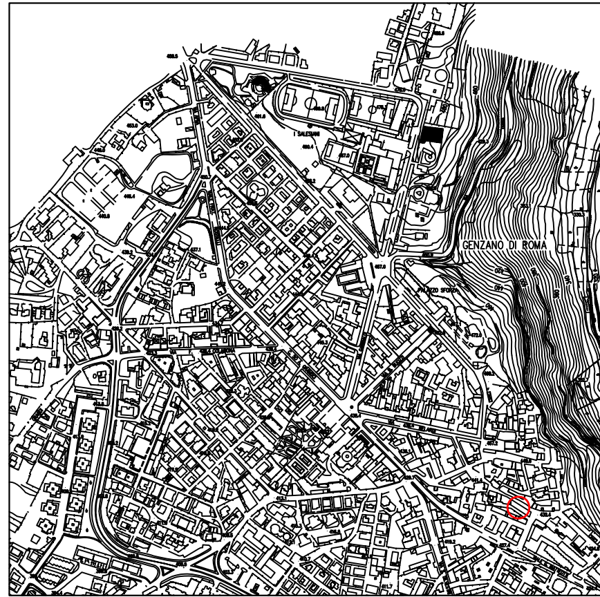
STRALCIO PLANIMETRIA AEROFOTOGRAMMETRICA Rapp. 1/10'000

VIA MARCO MOSCATO da n°52- a 64, Part. n°388