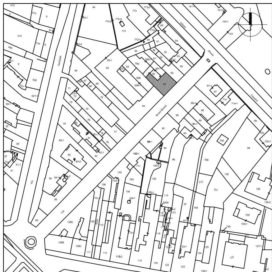
STRALCIO PLANIMETRIA CATASTALE Rapp. 2'000